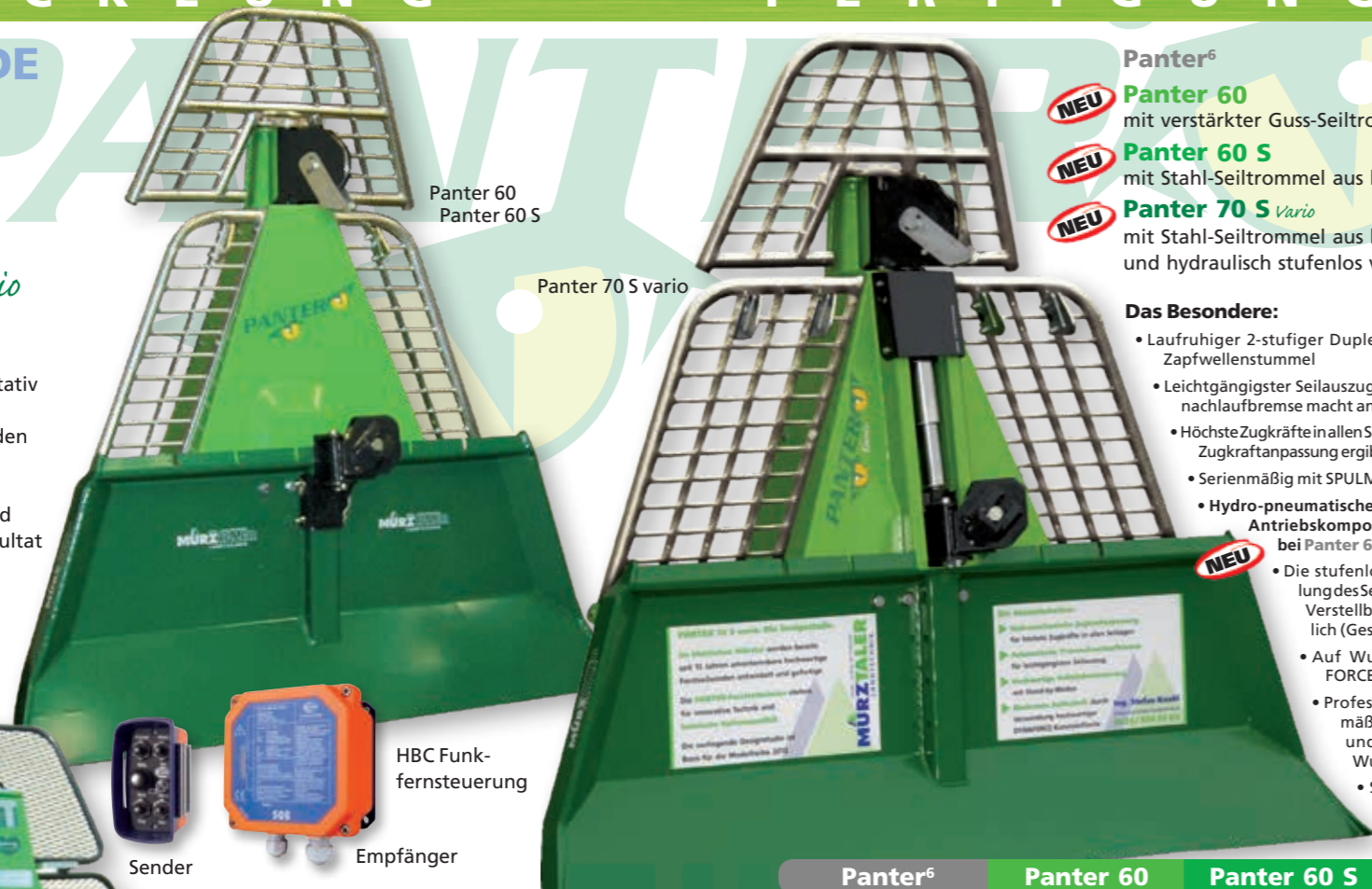
Panter 60 Panter 60 S

Seit 15 Jahren werden im Steirischen Mürztal Forstseilwinden produziert. Von Beginn an war es unser Ziel, qualitativ hochwertige Forstseilwinden, die sich durch innovative Detaillösungen von den Mitbewerbern unterscheiden, für den alpinen Bereich anzubieten. Der derzeitige hohe Entwicklungsstand der PANTER-Fortseilwinden ist das Resultat laufender Weiterentwicklung.